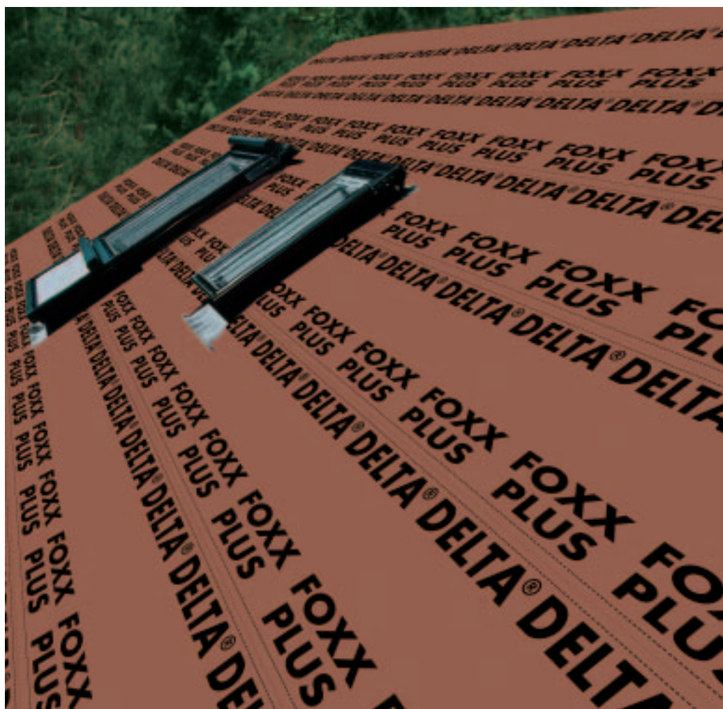
De gemakkelijke en eenvoudige plaatsing van DELTA®-FOXX PLUS drukt de kosten.

DELTA®-FOXX PLUS met geïntegreerde kleefstrook voor een snellere winddichte plaatsing.