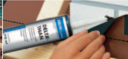
Winddicht met DELTA®-FOXX PLUS.