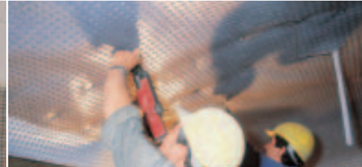
Gemakkelijke bevestiging aan de wand.