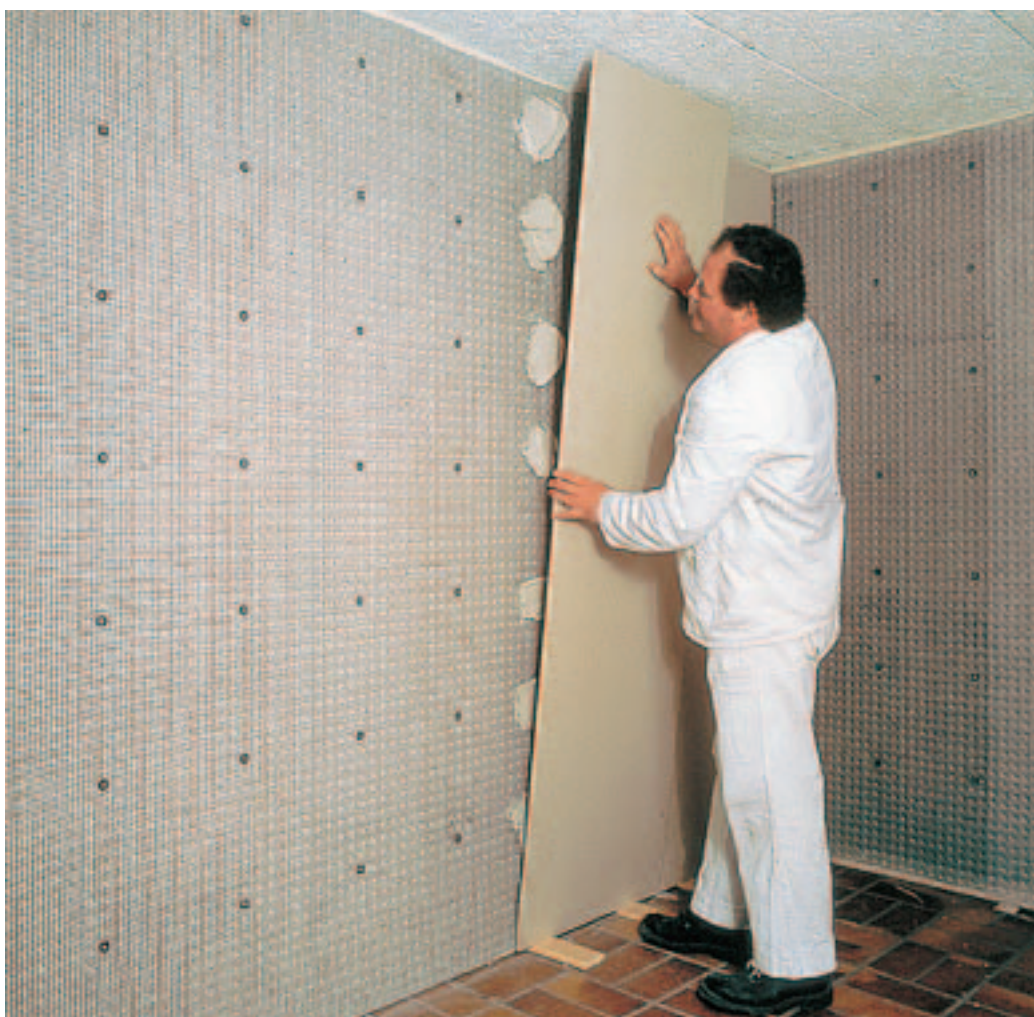
DELTA®-PT zorgt voor een waterdichte en stabiele basis voor een gips- en cementlaag of voor gipsplaten.