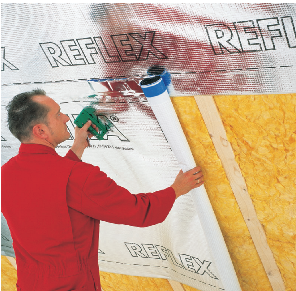
DELTA®-REFLEX PLUS – het universele lucht- en dampscherm.