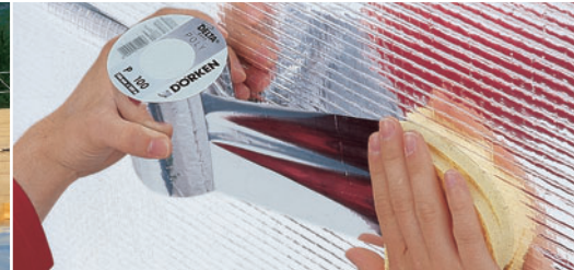
DELTA®-REFLEX PLUS met geïntegreerde kleefstrip.