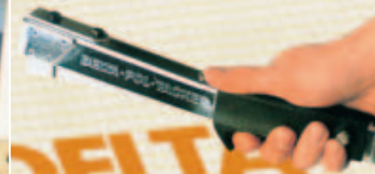
Mit jedem Tackerschlag wird die Armierung gefasst.