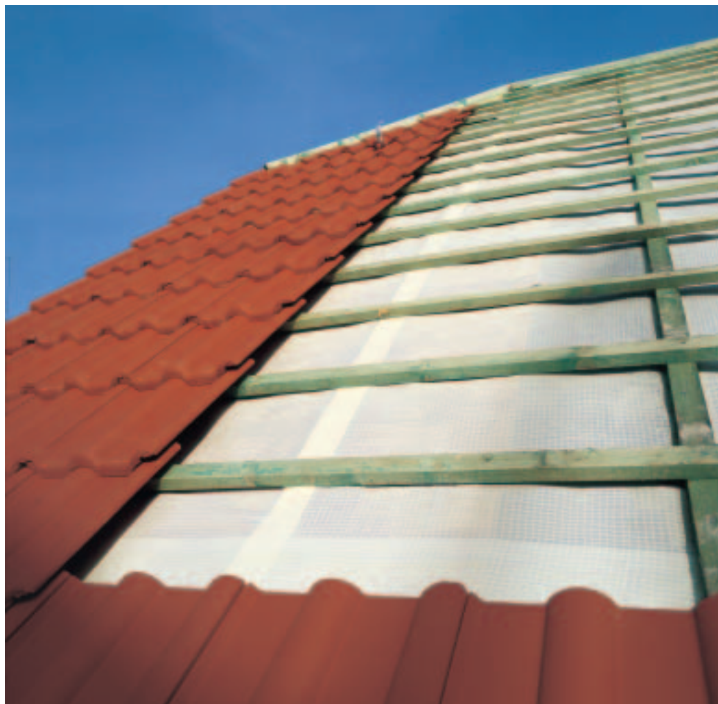
DELTA®-FOL SPF bietet eine hohe Verlegesicherheit und einen optimalen Schutz fürs Dach.