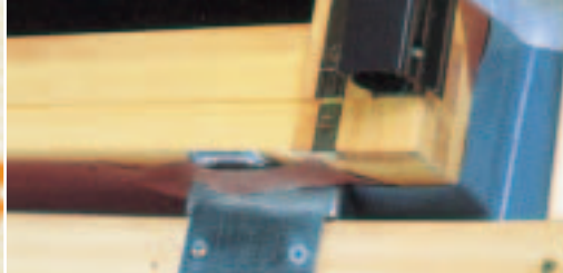
Sicherer Anschluss an Dachflächenfenster.