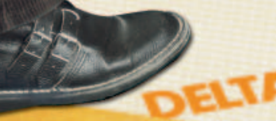
Hoch belastbar und absolut trittsicher.