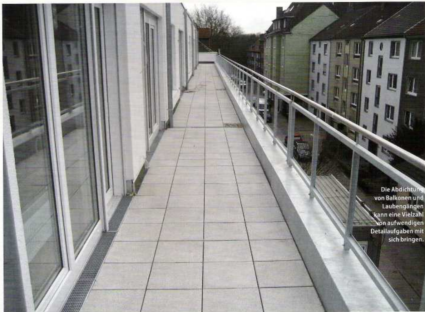
Die Abdichtung von Balkonen und Laubengängen kann eine Vielzahl von aufwendigen Detailaufgaben mit sich bringen.