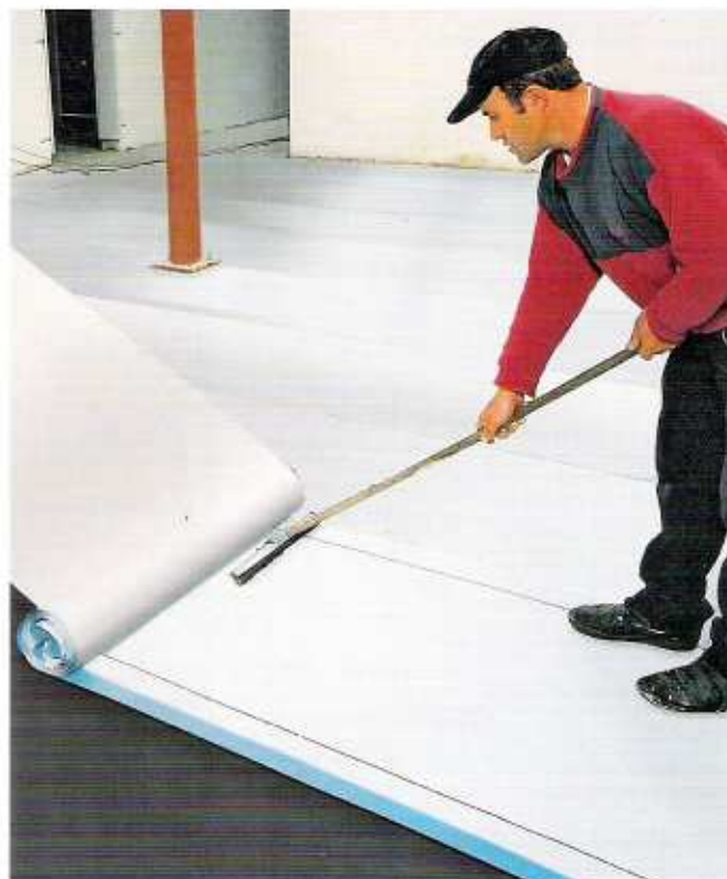
KSK-Bahnen werden in der Regel vollflächig klebend aufgebracht. Ihr Vorteil liegt in der kalten Verarbeitung, die eine Hitzeeinwirkung auf angrenzende Bauteile oder Bauelemente ausschließt.

Die Abdichtungsnorm befindet sich momentan im Überarbeitungsstadium. Ausgelöst durch die europäischen Normen für Abdichtungswerkstoffe musste auch die Deutsche Norm angepasst werden. Dies ist mit DIN 18195-2 im April 2009 geschehen. Dabei wurden neue Werkstoffe aufgenommen, wie mineralische Dichtschlämmen, Flüssigkunststoffe oder