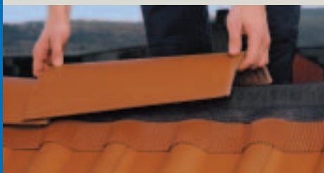
4. Poser la faîtière.