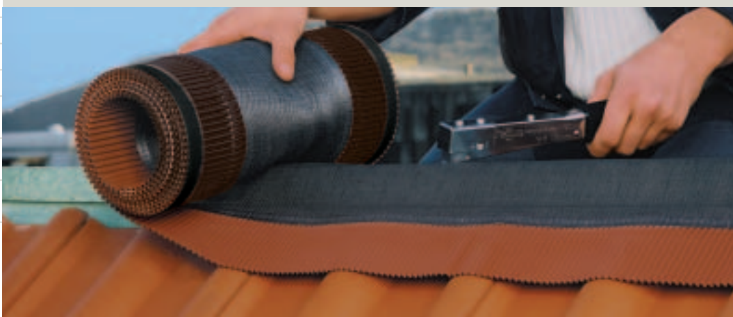
1. Agrafer DELTA®-VENT ROLL sur le faîtage.