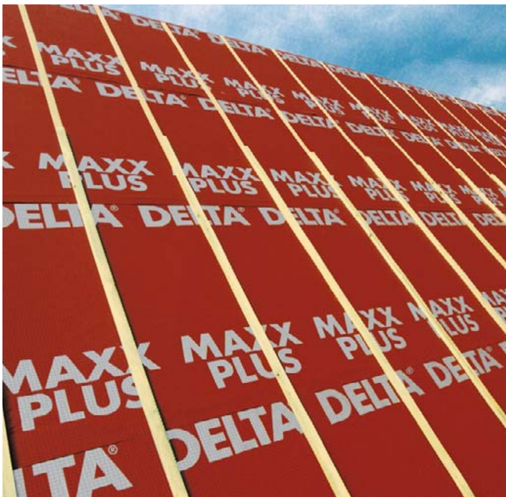
DELTA®-MAXX PLUS Energiesparmembran ist leicht und sicher zu verlegen.