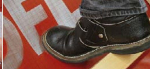
Detail beim Dachfenster-Einbau.