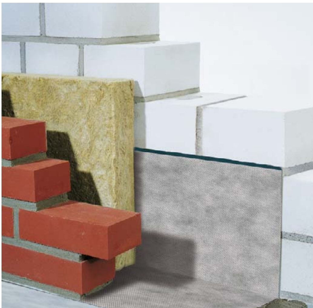
DELTA®-PROTEKT – die universelle EVA-Mauerwerksperre.