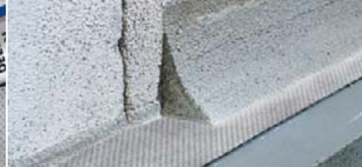
Seitlicher Überstand für Verbund mit Abdichtungsschichten.