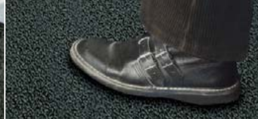
Einfache und schnelle Verlegung.