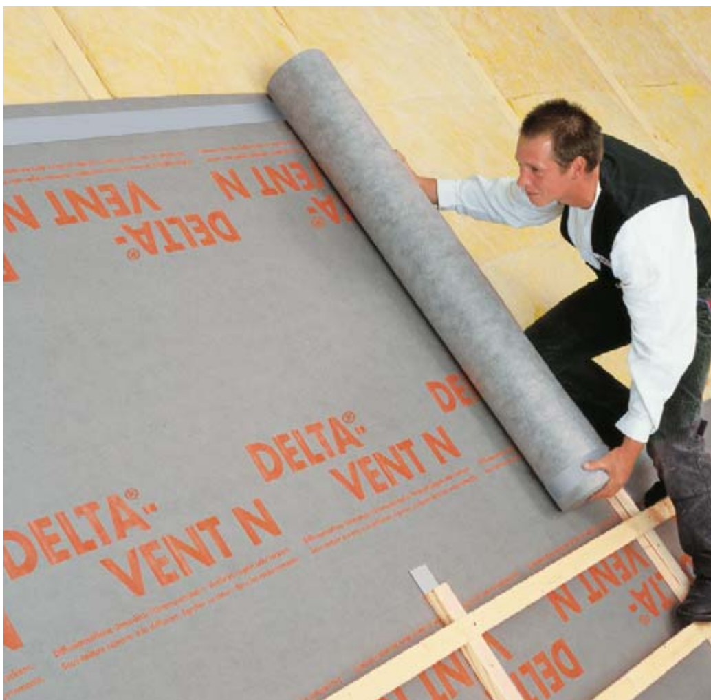
DELTA®-VENT N PLUS bietet als 3-lagige Bahn besondere Vorteile bei der Verarbeitung.