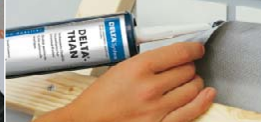
Winddicht durch integrierte Klebezonen.