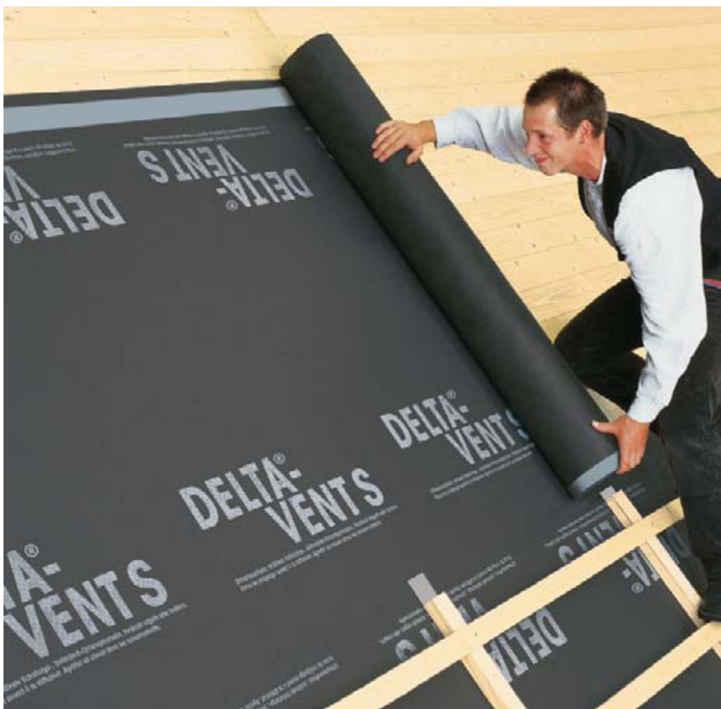
Als 3-lagige Bahn besitzt DELTA®-VENT S PLUS ein besonderes Plus bei der Verarbeitung.