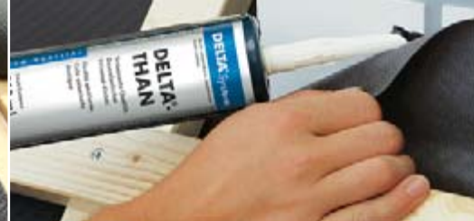
Winddicht durch integrierte Klebezonen.