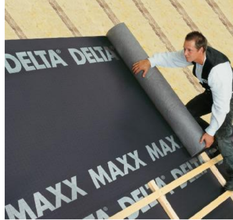
DELTA®-MAXX – Eğimli çatılarda Almanya'nın en çok tercih edilen çatı örtüsü.