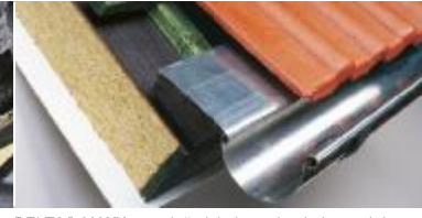
DELTA®-MAXX çatı oluğu içinde sonlandırılmamalıdır.