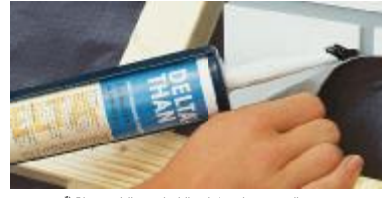
DELTA®-Sistem bileşenleri ile daha da güvenli.

Özellikle dayanıklı. Zor alev alır. Su geçirmez.