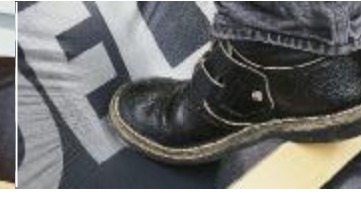
Yüke ve yürümeye karşı son derece dayanıklıdır.