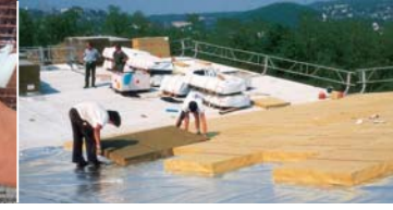
Sanayi tipi hafif çatılarda kullanım örneği.