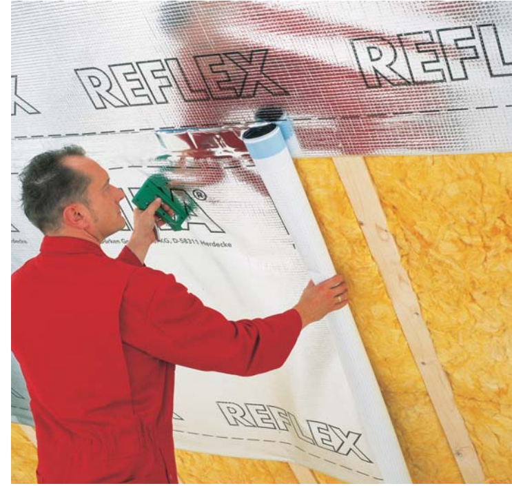
DELTA®-REFLEX - üniversal hava ve buhar bariyeri.

DELTA®- REFLEX PLUS Kendinden entegre edilmiş yapışkanlı bant ile