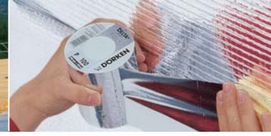
DELTA®Sistem-bileşenleri ile kolayca döşenir..

■ İçte: DELTA®-REFLEX Hava ve buhar bariyeri. Isıya karşı % 10 daha fazla koruma. Hava ve buharı % 100 oranında durdurur.