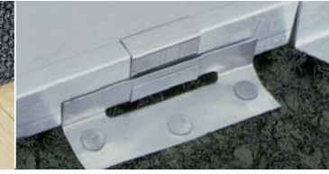
Çatı kaplamasının sorunsuz bir şekilde genişmesini sağlar.