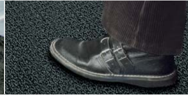
Kolayca yürünen, kaymayan kabarcıklı yapısı sağlar.

■ Dışta: DELTA®-TRELA Metal çatının alt tarafında nemin birikmesine izin vermeyin. Korozyonu etkili bir şekilde önleyin. Ve etkileyici mimari yapıyı koruyun.