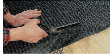
Kolay ve hızlı bir şekilde uygulanır.

Nemin birikmesini önler. Korozyonu durdurur. Damlama seslerini azaltır.